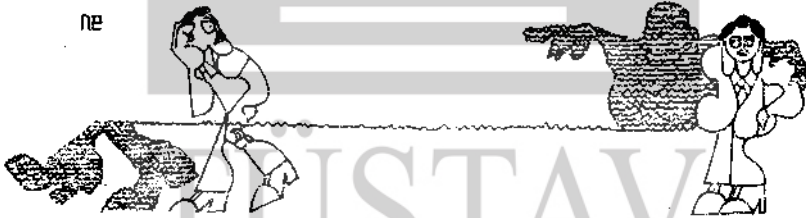
(Yürüyüş'ten "İlerleme Adına Gerileme")

Bu noktalardan şu ortaya çıkıyor; Sosyalist devrim dışında hedef gösteren herkes işçi sınıfının gücüne güvenmediğini ortaya koymuş oluyor. Çünkü feodalite ile tekeller gibi uç noktada da olsa işçi sınıfına gösterilen hedef sosyalizmden önceki birtakım "başka şeyler" oluyor.