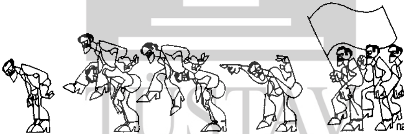
(Yürüyüş'ten "Aşamacılıkta Aşama")

TİP'in Sosyalist Devrimi reddettiğinin en önemli ve son göstergesi broşürün 54. sayfasında yer alıyor. TİP burada, olabildiğince açık bir biçimde aşamayı öngörüyor. "Partimiz öte yandan, 'sosyalist devrimden önce işbirlikçi tekelci büyük sermayenin ve toprak sahiplerinin siyasal gücünün kırılması sonucu gerçekleşecek, fakat henüz sosyalist bir nitelik taşımayan' bir iktidar olasılığını reddetmemektedir. 'Geçici' ve devrimci bir karakter taşıyacak ve sosyalist devrime çeşşin bir ilk evresi (abc) haline dönüştürülebilecek bu olasılığın... "diyor ve aynı minval üzere sürüp gidiyor. Dünyanın her yerinde, aşamaları savunuların öngördüğü geçiş modeli, aynen TİP'in söylediği gibidir," "Sosyalist bir nitelik taşımayan", "tekellerin, büyük toprak sahiplerinin siyasal gücünü kıran" bir iktidar, sosyalist devrimin önüne konulan aşamanın evrensel formülasyonudur. Fazla uzağa gitmeye gerek yok. Türkiye'de aşamalı geçişi öngörenlerin programlarına bakılabilir. Aynen TİP'in öngördüğü "evreyi" öneriyorlar. Açık açık savunuyorlar. ve "aşamalı geçiş iyidir" diyorlar. TİP işe açık açık savunmaya başladığı aşama-